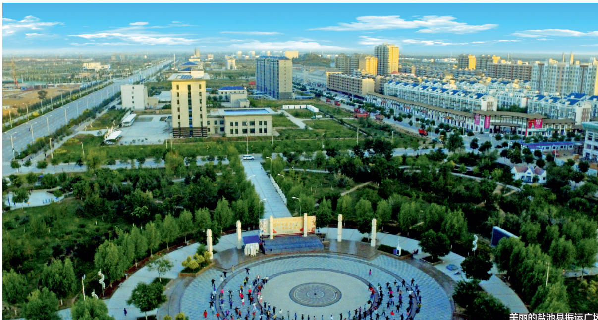
美丽的盐池县振兴广场

盐池县深入打好污染防治攻坚战,全县生态环境质量持续改善,扎实推进大气污染防治。近3年优良天数比例分别达到92.0%、88.6%、87.4%,PM 2.5 平均浓度控制在26微克/立方米,环境空气质量稳定在国家二级标准。