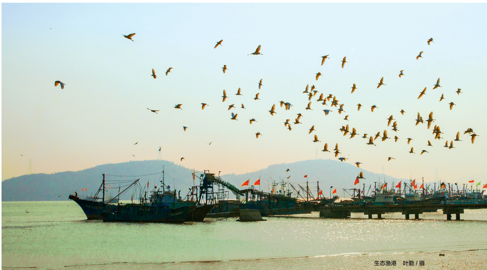
生态渔港