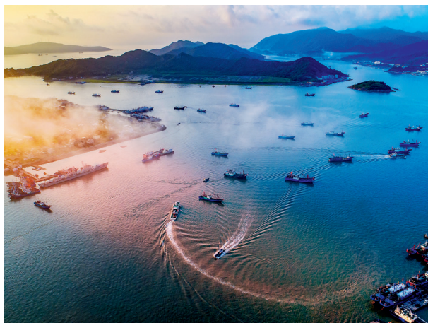
破晓之弧 周祖安 / 摄