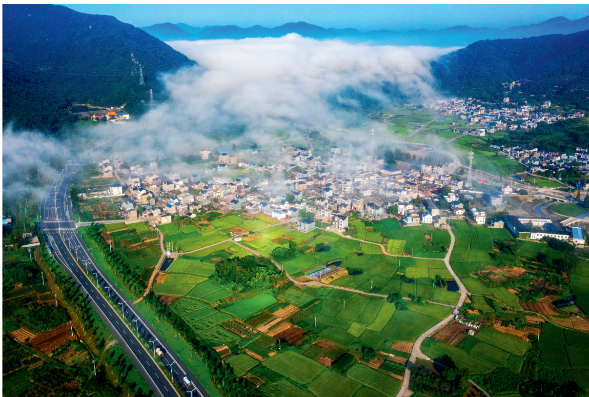
纵横阡陌

在乡村振兴方面,以“千万工程”为引领,打造农村人居新环境,创新推出“一户多宅”村庄梳理式改造、“村民说事”、农村宅基地“三权分置”等系列改革举措,突出抓好精品农业、乡村旅游、民宿经济等美丽经济新业态。