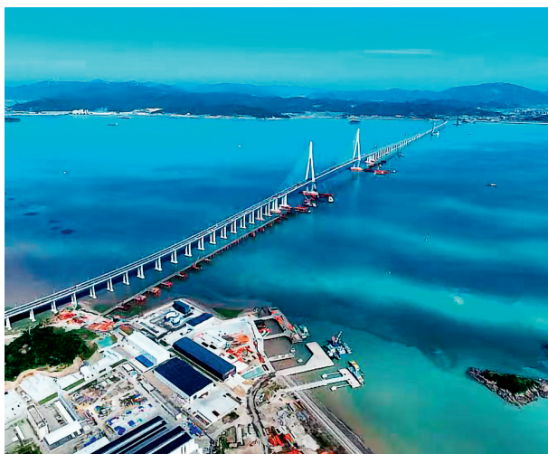
蔚蓝象山港