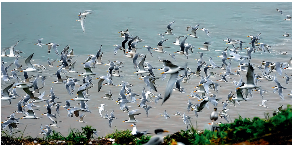
群鸥飞扬