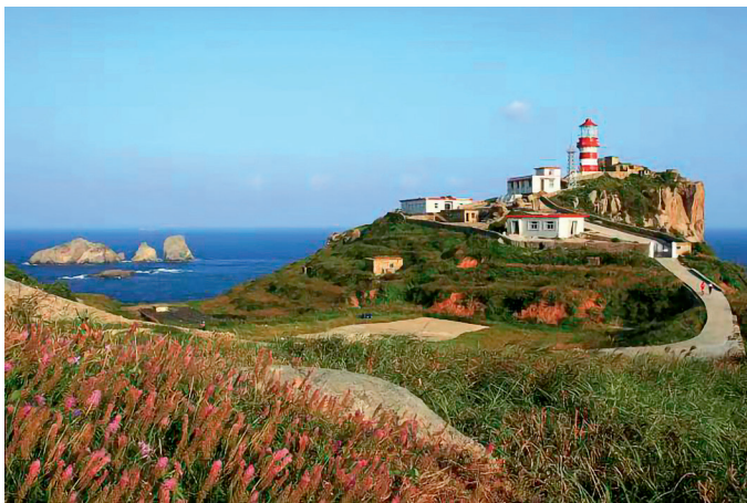
美丽渔山岛

20世纪七八十年代,近海渔业资源的枯竭,让当地人不得不另谋出路,有的外出务工,有的做起了“资源”生意。在爵溪街道工作了大半辈子、马上就要退休的励先强介绍,“那个时候的爵溪,一船一船的沙子和石头作为优质的建筑材料被运到上海、杭