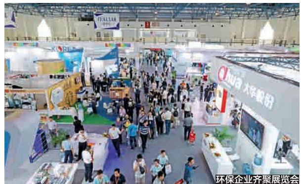
环保企业齐聚展览会