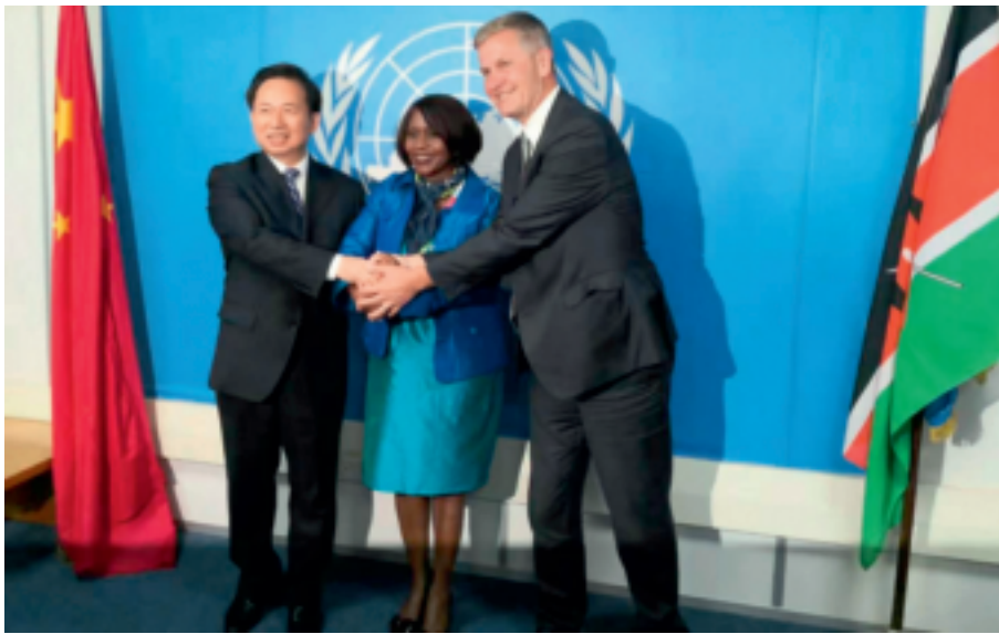
2017年12月4日，中非合作协议，时任原环境保护部部长李干杰（左一）、肯尼亚环境、水与自然资源部朱迪·瓦克洪古（左二）、时任联合国环境署执行主任埃里克·索尔海姆（右一）共同签署关于设立中非环境合作中心的项目合作意向书。