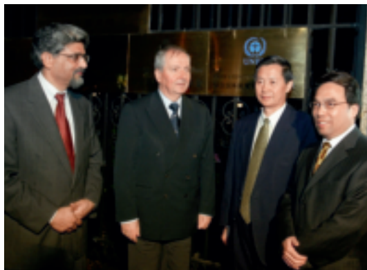
2003年9月19日,联合国环境署驻华代表处在北京正式揭牌,时任联合国环境规划署执行主任克劳斯·特普费尔(左二)、时任国家环境保护总局副局长祝光耀(右二)参加揭牌仪式。