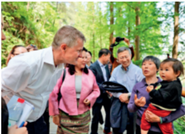
2018年4月，时任联合国环境署执行主任埃里克·索尔海姆参观走访浙江乡村，他说：“我在浙江、浦江和安吉看到的，就是未来中国的模样，甚至是未来世界的模样。”