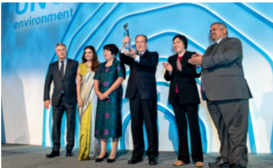
2018年9月26日，联合国环境规划署“地球卫士奖”颁奖典礼在纽约曼哈顿举行，浙江“千村示范、万村整治”工程获颁“地球卫士奖”的“激励与行动奖”。