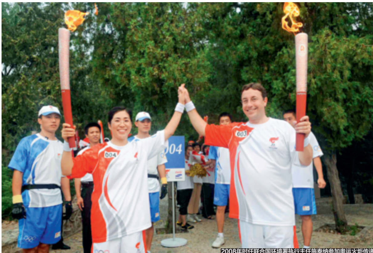
2008年时任联合国环境署执行主任施泰纳参加奥运火炬传递