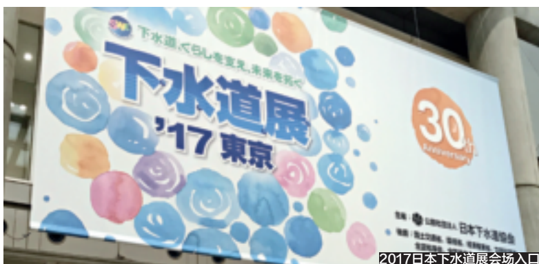
2017日本下水道展会场入口

2017年8月1日至8月4日，第30届“2017下水道展”在东京国际会展中心举行。展会希望通过世界各国下水道领域专业人员的互动交流加快技术发展步伐、全力推动下水道展走向全球化，推进河流、湖泊和海洋等公共水域保持水环境清洁。