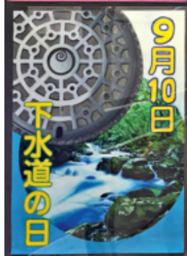
绘画获奖作品展区