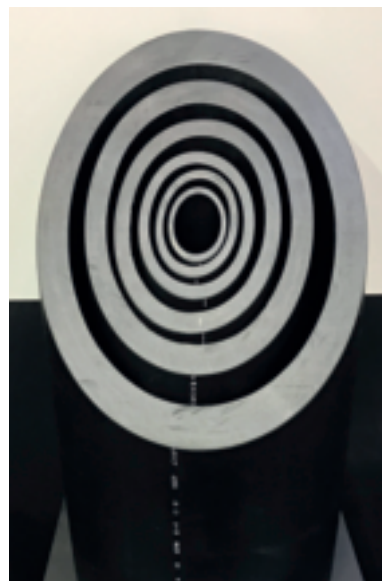
高密度聚乙烯管道