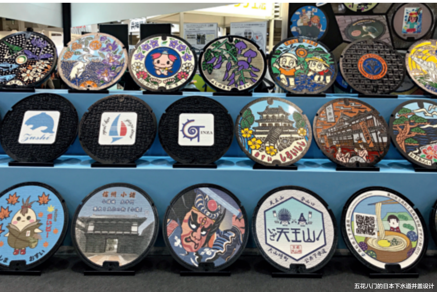
五花八门的日本下水道井盖设计

本届展会共有来自世界各国的 350 家企业展示全球领先的下水道相关技术与设备产品，并有来自世界各地的 55792 人参观。展会共设 1102 个展台，展示产品包括下水道的建造、设计、测量、维修管理领域的最新成果，以及管路材料器材、污水处理、操作系统的最新研发成果，并且还专设了公众参与体验区。