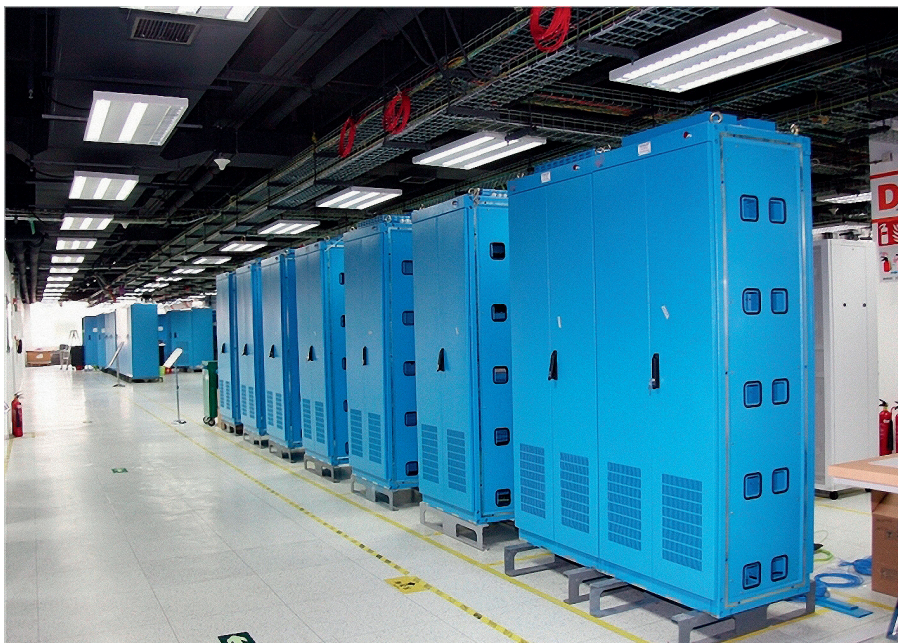
和睦系统核级DCS样机