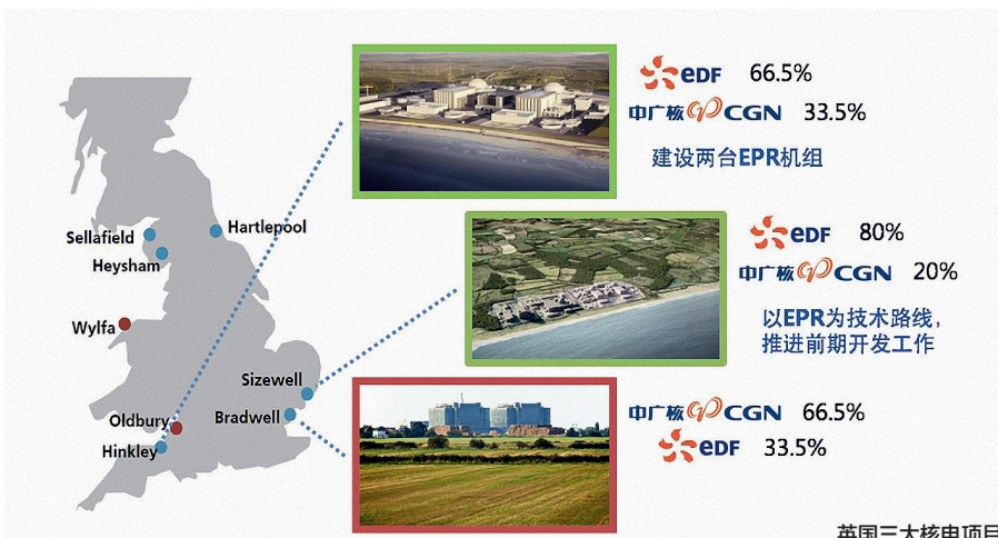
英国三大核电项目

产总额和经营业绩稳定保持在央企第一方阵，成为国务院国资委重点盈利企业和重点增利企业，实现了“十三五”良好开局。