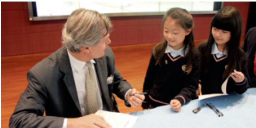
冈特先生为上海世界外国语小学的孩子们签名留念