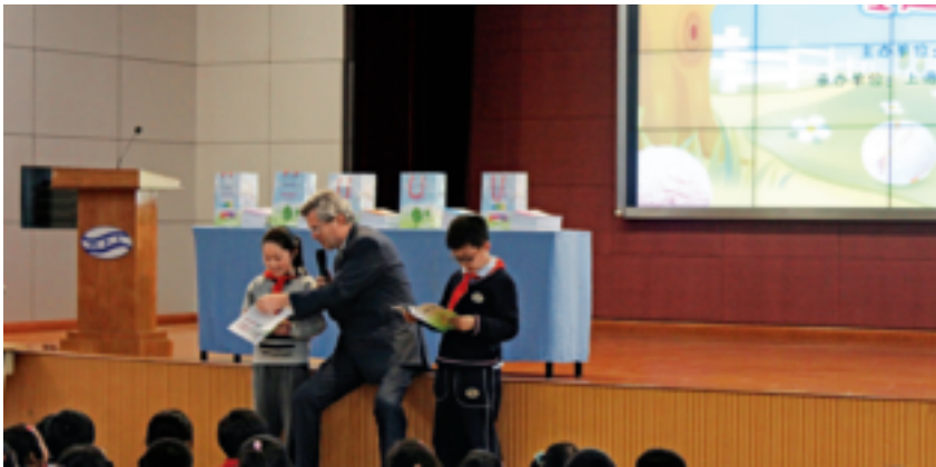
冈特先生和孩子们一起讲童话