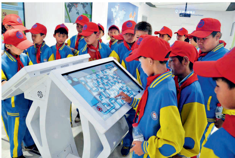
昆明长水中心小学学生参观昆明 空港经济区垃圾焚烧发电厂