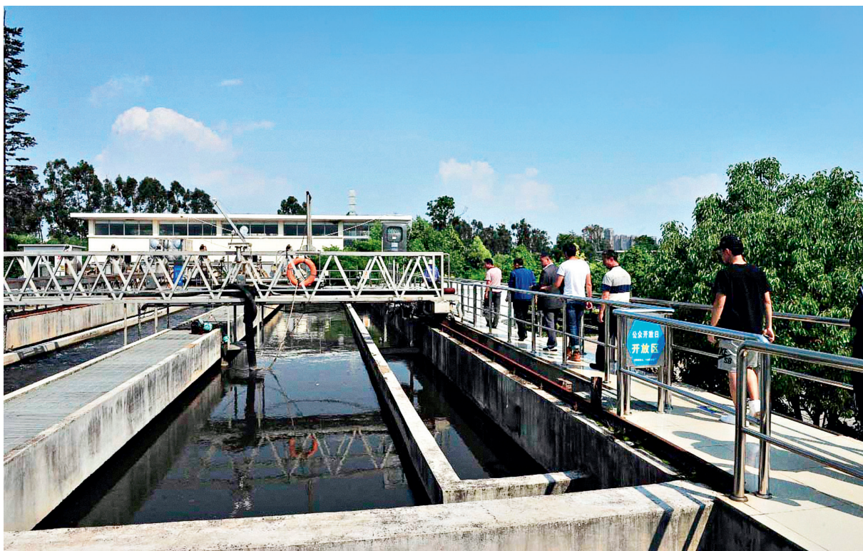
云南滇池学院的学生老师参观昆明市第七、八水质净化厂

“只有了解,才能热爱;只有热爱,才能保护”。环境保护不仅是政府和企业的的事情,更需要社会各界的参与和支持。公众是环境保护的宣传员、推动者和践行者。