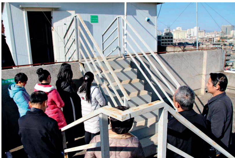
参观者参观云南省环境监测中心站

灰的无害化处理、炉渣综合应用,回收余热利用以及发电厂排放物及环保指标要求等都是参观者关注的话题。该厂的环保教育展厅能够观看生活垃圾焚烧厂工艺的科普视频,并有互动环节,可在寓教于乐的环保游戏中体验环保认知的快乐。在中央控制室和垃圾吊控制室,参观者可亲眼目睹垃圾焚烧处理工艺中垃圾分拣和焚烧的自动化操控过程,了解生活垃圾焚烧处理工艺。