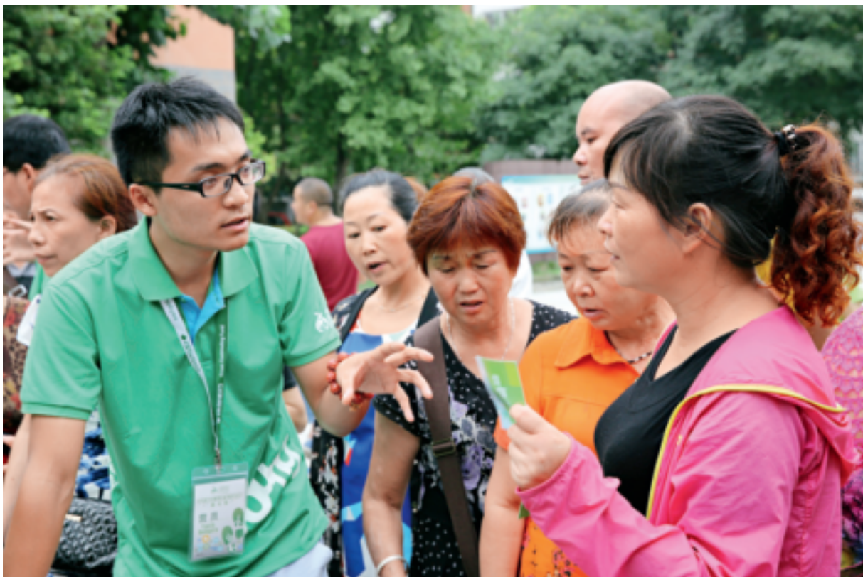
青年使者在街头向公众宣传环保知识