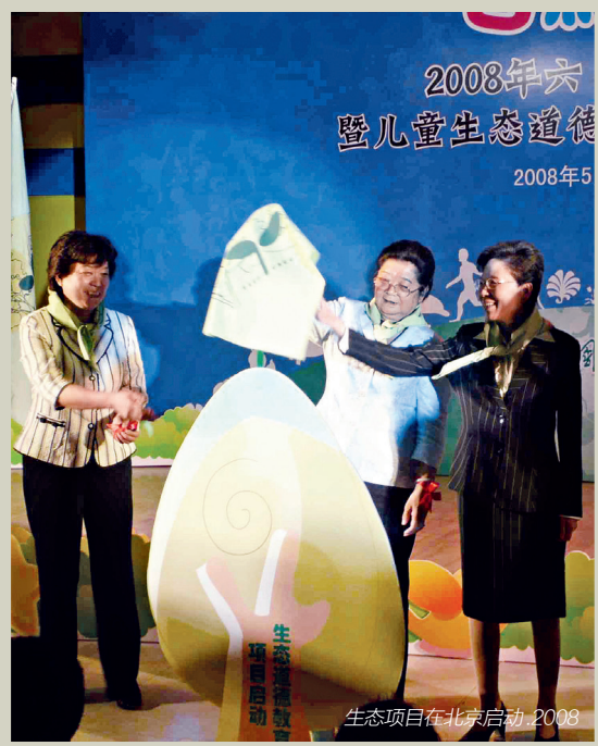
生态项目在北京启动,2008

生态项目于启动之际,就设计了一套集研究、培训、活动、基地建设及宣传五维工作为一体的、复合型的项目运作方式。五维工作相互关联和支撑,促进项目的体系化建设和取得可持续发展的效应。五维工作的重点及相互关系可以做这样一个比喻:“研究”好比是我们的头脑,通过它产生思想、智慧和意识,去指导和协调我们的行动;“培训”好比是我们的血脉,通过它运输和反馈大脑的思想和智慧;“活动”好比是我们的手脚,通过它的行动去实现思想获得健康;“基地”好