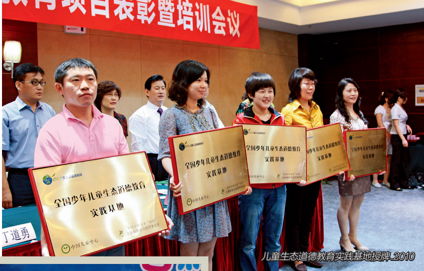
儿童生态道德教育实践基地授牌,2010

比是加油站,在每一个加油站中补充和获得能量和动力;“宣传”好比是净化和营造四周清新健康的空气,获得理念的推广及为别人获取经验。