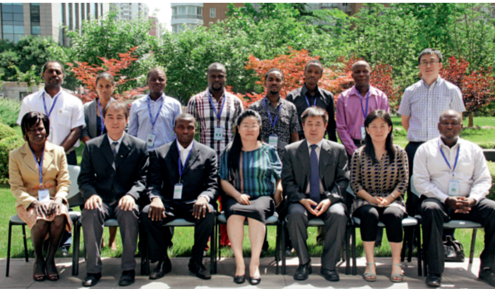
研修班学员集体合影