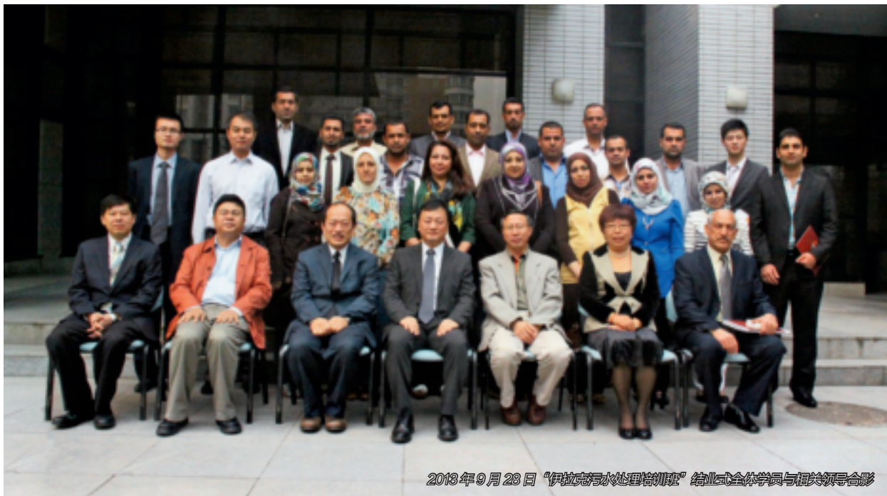
2013年9月23日“伊拉克污水处理培训班”结业式全体学员与相关领导合影

一朵鲜花打扮不出美丽的春天，在全球环境问题日益严重的当下，一个国家环境发展得再好也不能解决全球的环境危机。在事关人类生存环境的问题上，需要全人类携手迎战，更需要扶弱济困，帮助弱势国家迅速提升环境治理能力，这样才能让每个角落都盛开出鲜花，才能拥有春光明媚、繁花似锦的美丽春天。