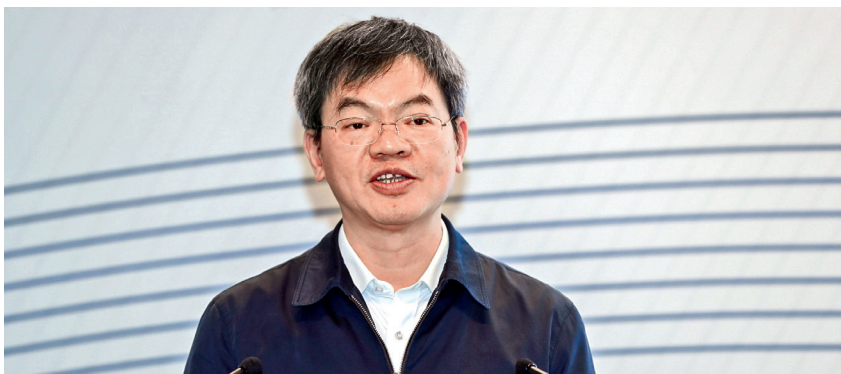
生态环境部庄国泰副部长参加资助仪式并致辞

“迈向生态文明 向环保先锋致敬”项目旨在引导和推动社会团体的健康发展，大力发挥社会团体参与环保公益事业的作用。该项目由生态环境部指导，中华环境保护基金会、中国扶贫基金会联合主办，联合国环境规划署、清华大学环境学院支持，一汽-大众新未来基金出资支持。