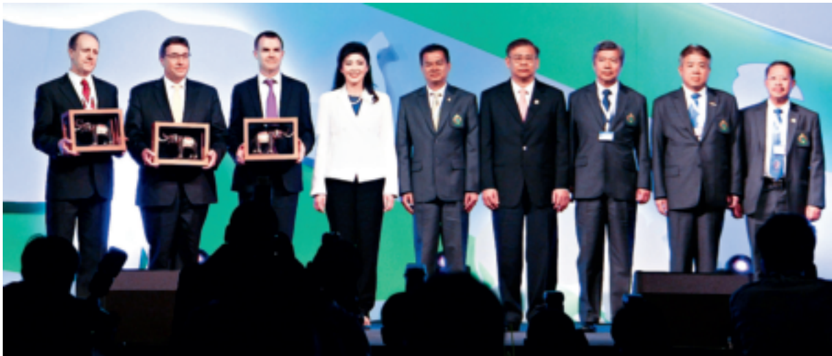
前泰国总理英拉·西那瓦(左四)、联合国环境署执行主任阿希姆·施泰纳(左二)和其他参加第16次缔约方大会的贵宾合影

决定。缔约方大会下设的科学委员会,包括植物委员会和动物委员会就科学事项提出咨询意见。