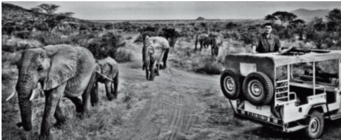
姚明宣传大象保护