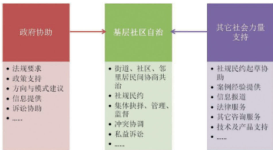
图1 以社区组织为中心力量的环境社会自治模式