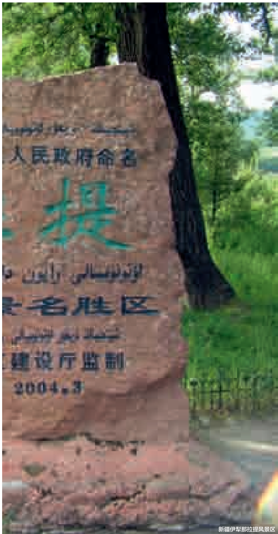
新疆伊犁那拉提风景区

走进新疆,不但近距离感受了沙漠绿洲的绿、沙漠黄沙的黄、大戈壁荒凉的荒,同时也感受到了英雄树——胡杨的壮美和它顽强的品格:“生一千年不死,死一千年不倒,倒一千年不朽”,这是多么不可思议的生命力。