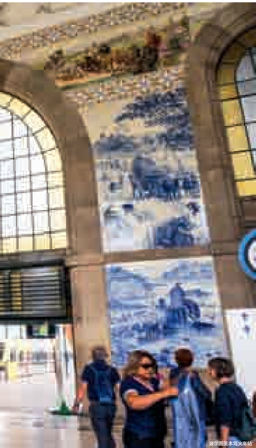
波尔图圣本笃火车站

摇摇晃晃的复古电车在老城区缓缓驶过,叮当声响在狭窄的巷子里悠扬回荡;细腻哀婉的歌声中,蕴藏着大航海时代的光辉岁月;科英布拉大学的学生们至今保留着穿黑袍校服的传统,这也是电影《哈利·波特》系列里魔法斗篷的灵感来源。在校园里走一走,恍惚间穿越到神奇的魔法世界。葡萄牙向来以人少景美口碑好著称,而伊比利亚半岛上的异域风情也不容错过。