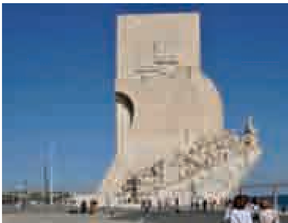
航海大发现纪念碑