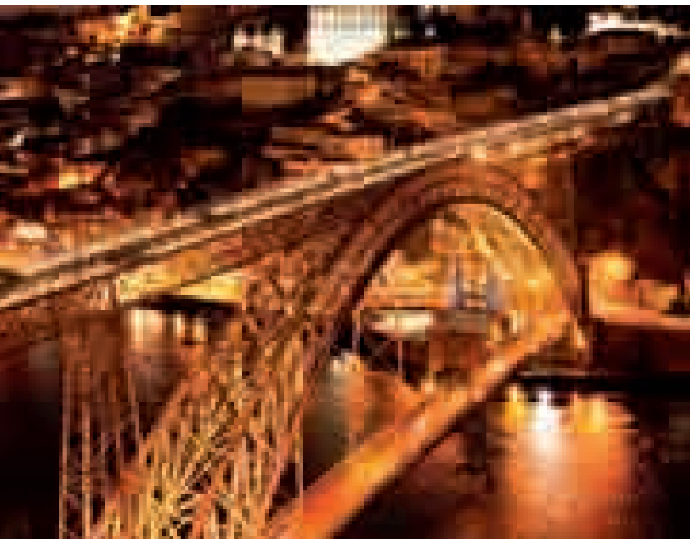
波尔图路易斯一世桥