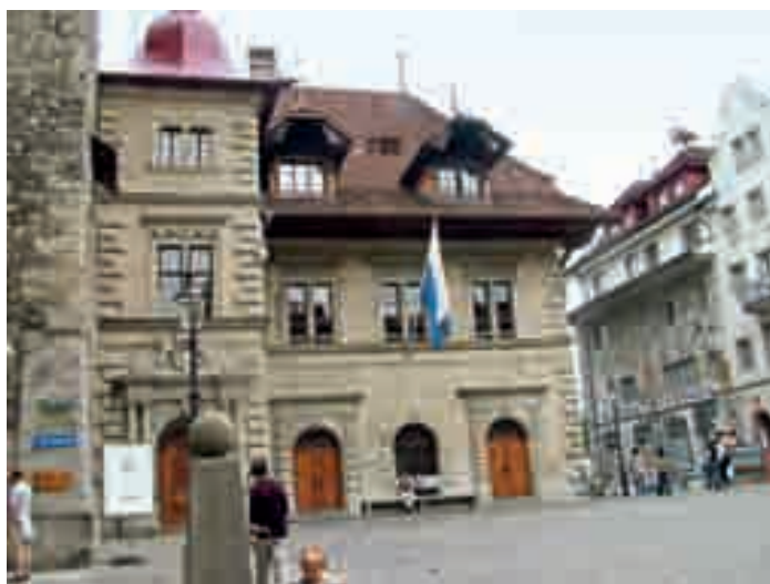
古建筑的外墙和造型