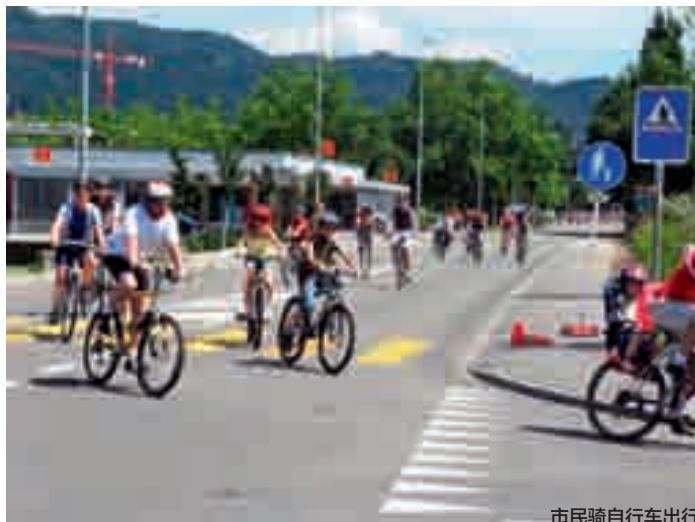
市民骑自行车出行