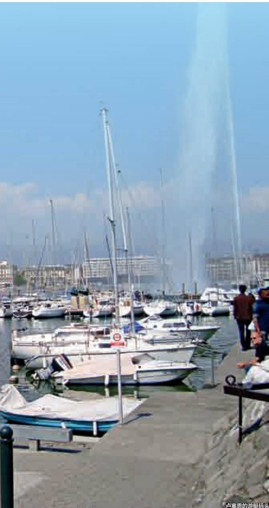
卢塞恩的游艇码头

多次去过瑞士,去过瑞士多个城镇乡村,感觉瑞士真是世界上最美的国家,人间天堂,名不虚传。而小城卢塞恩无疑是瑞士最美的城市之一,很多名人形容“最美不过卢塞恩”,的确名副其实,形容得恰如其分。