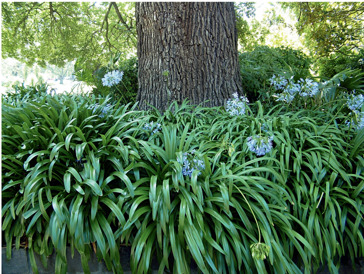
墨尔本绿化绿葱葱的植物

世界最适合人类居住的城市之一。尽管评选宜居城市的条件有多条,但环境是基本条件之一。墨尔本的街头绿树成荫,鸟语花香。草地上人们嬉笑玩乐,广场上鸽子和海鸥争相取食,一副人与自然和谐共处的悠闲画面。在墨尔本,即使是最为繁忙的市中心,也没有拥挤的车流和呛鼻的汽车尾气。大力发展公共交通是造就墨尔本保持美丽的秘诀之一。墨尔本政府总是鼓励人们,包括工人、居民、游客,尤其是留学生选择乘坐电车、火车和公交车,它们成为墨尔本良好的交通出行方式。