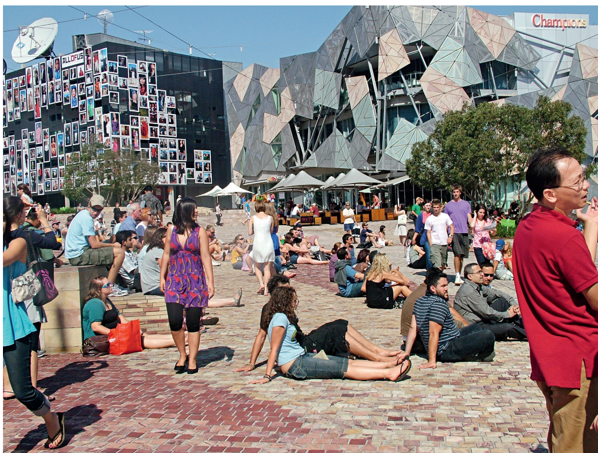
联邦广场，市民席地而坐观看大屏幕上的体育赛事