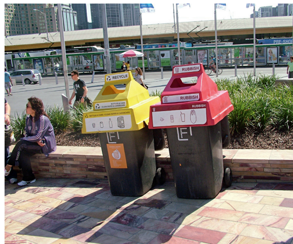
联邦广场边上的垃圾筒