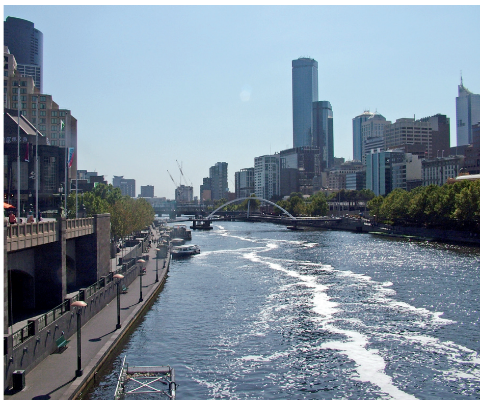
流经市内的亚拉河