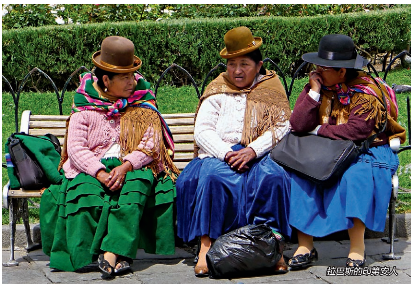
拉巴斯的印第安人