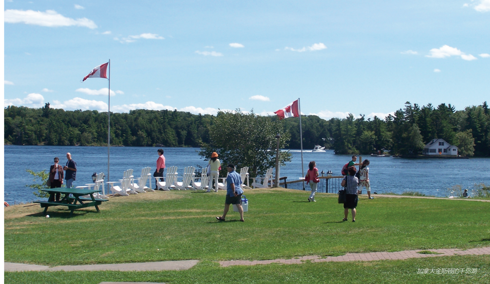
加拿大金斯顿的千岛湖

众所周知，森林、草坪及其他绿色植被能吸收大量的二氧化碳，调剂大气温度，增加空气中的氧分子，净化空气，蓄积了大量水分，是人类赖以生存的必要条件。不仅如此，它还是其他动物的乐园和栖息场所，甚至是其食物来源。在加拿大，鸟兽与人共生共舞，不仅在森林里到处可见，就是在城市的社区也不新鲜。在城市社区，人们最常看到的是松鼠。那些可爱的小家伙，一天到晚都围绕着居民觅食。一会儿在草地上东抓西挠，一会儿坐在那里，用双手捧着坚果，津津有味地咀嚼。吃饱喝足了，就爬上树