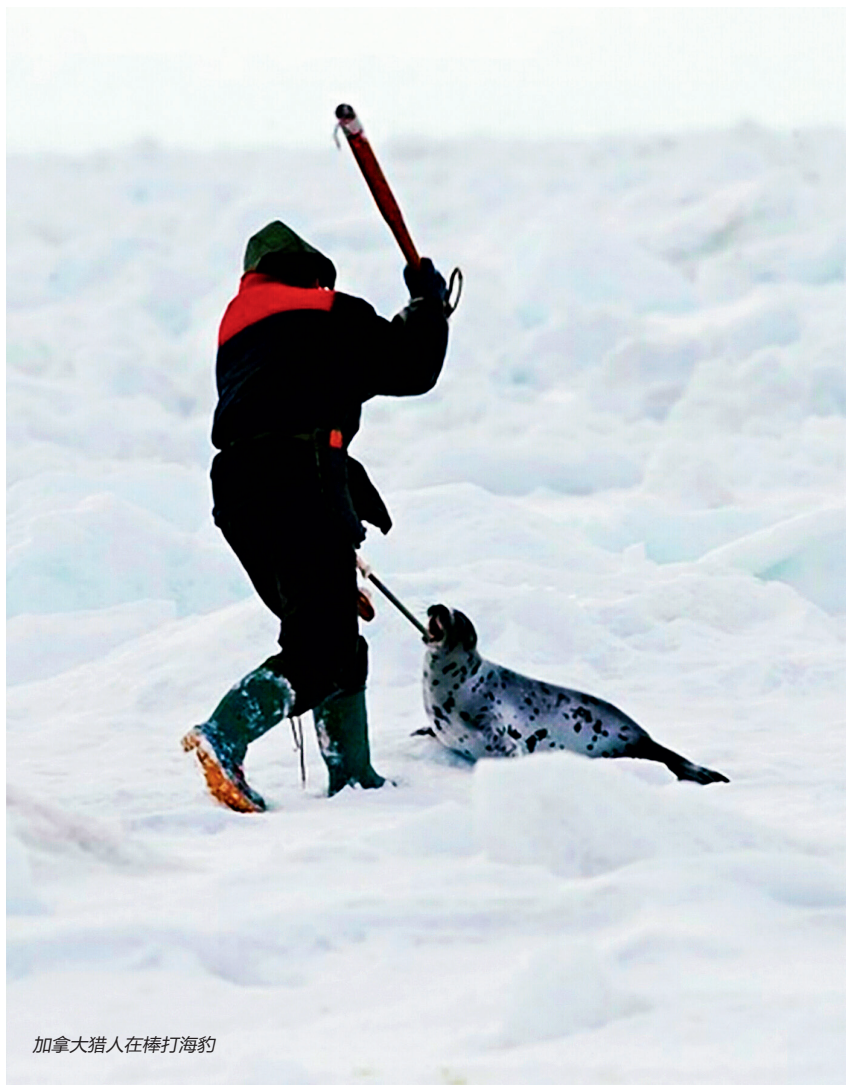
加拿大猎人在棒打海豹