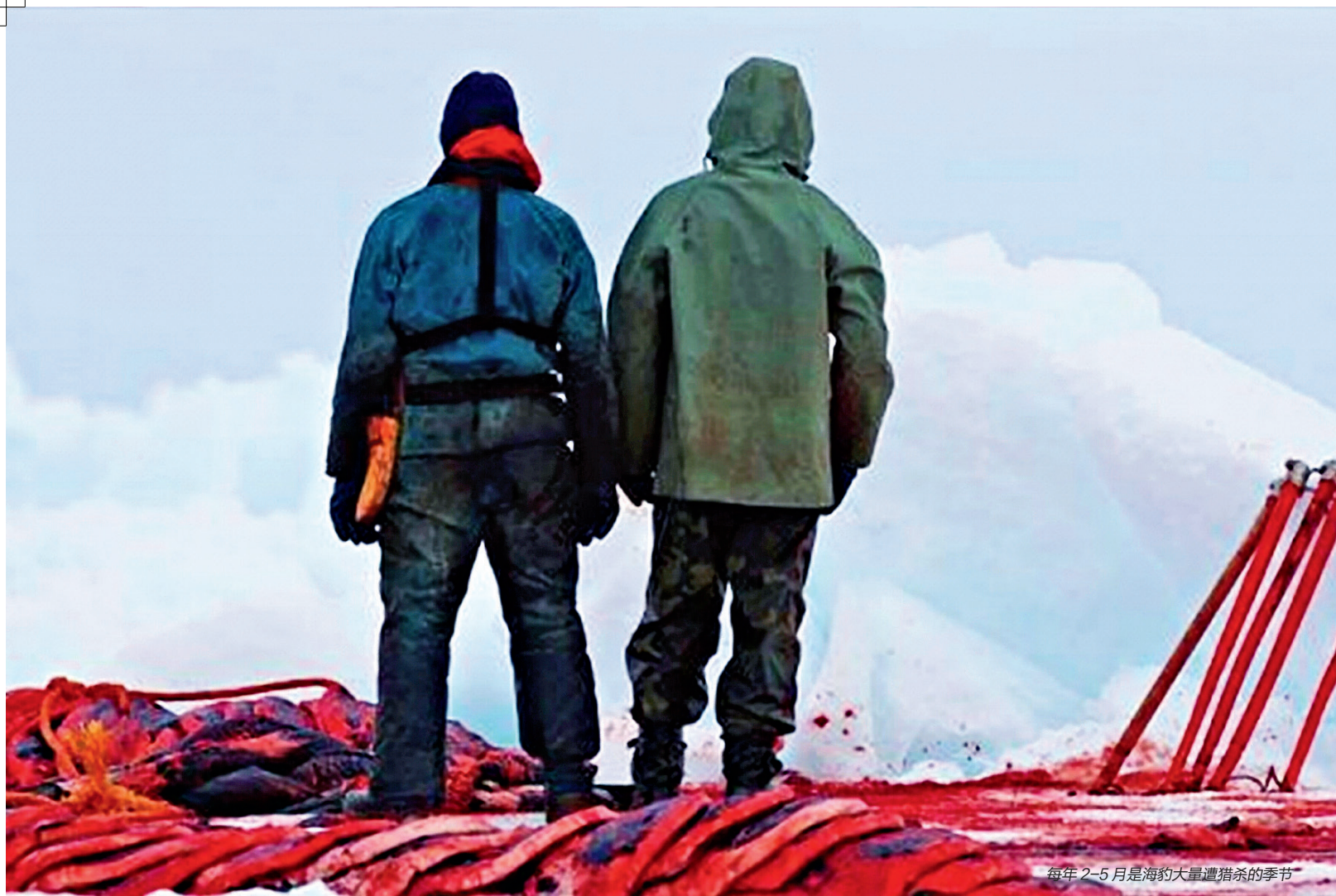
每年2-5月是海豹大量遭猎杀的季节

的野蛮行为。俄罗斯总统普京表示：“捕杀海豹是一个非常血腥的行业”。美国、墨西哥、俄罗斯、日本等国已禁止海豹产品进口。美国科学家证明，海洋哺乳动物贸易引起了动物种群数量的急剧下降。