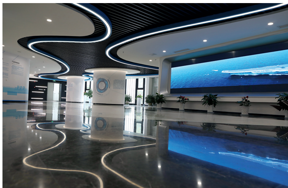
整洁美观的项目办公区