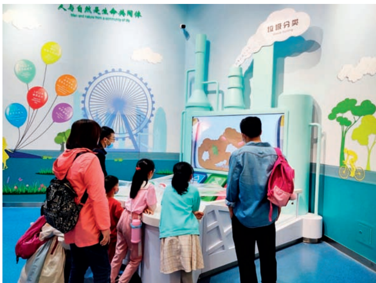
观众体验展品“垃圾分类”