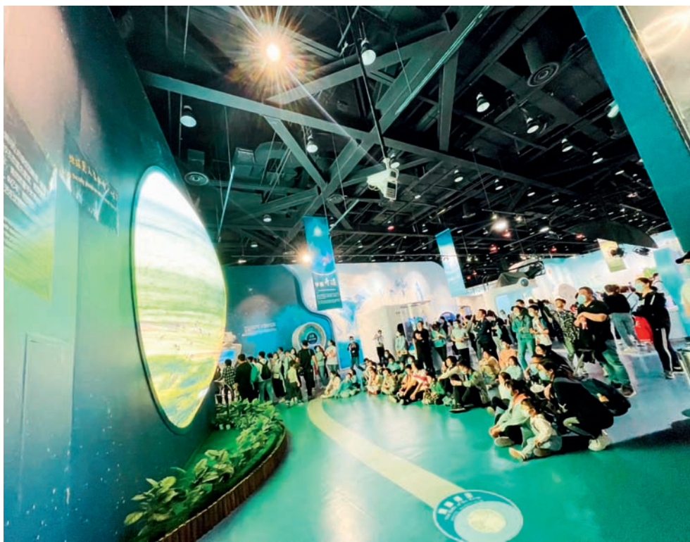
观众体验展品“蓝色星球”

设带来的生态环境变化,重塑社会的生态文化信仰,树立正确的生态文明观,培养生态意识行为,引导社会公众投身到珍爱地球家园、保护生态环境的行动中,呵护唯一家园,共创美好未来。展览凝练出了“唯一、共生、守护”的教育理念,感悟地球对于人类的独一无二,领会人与自然和谐共生的紧密关系,意识到呵护地球是人类共同的责任。