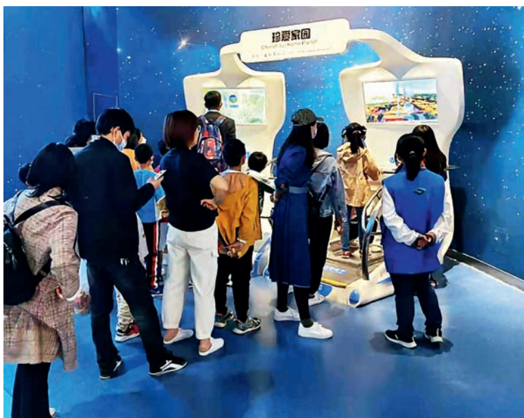
观众体验展品“珍爱家园”