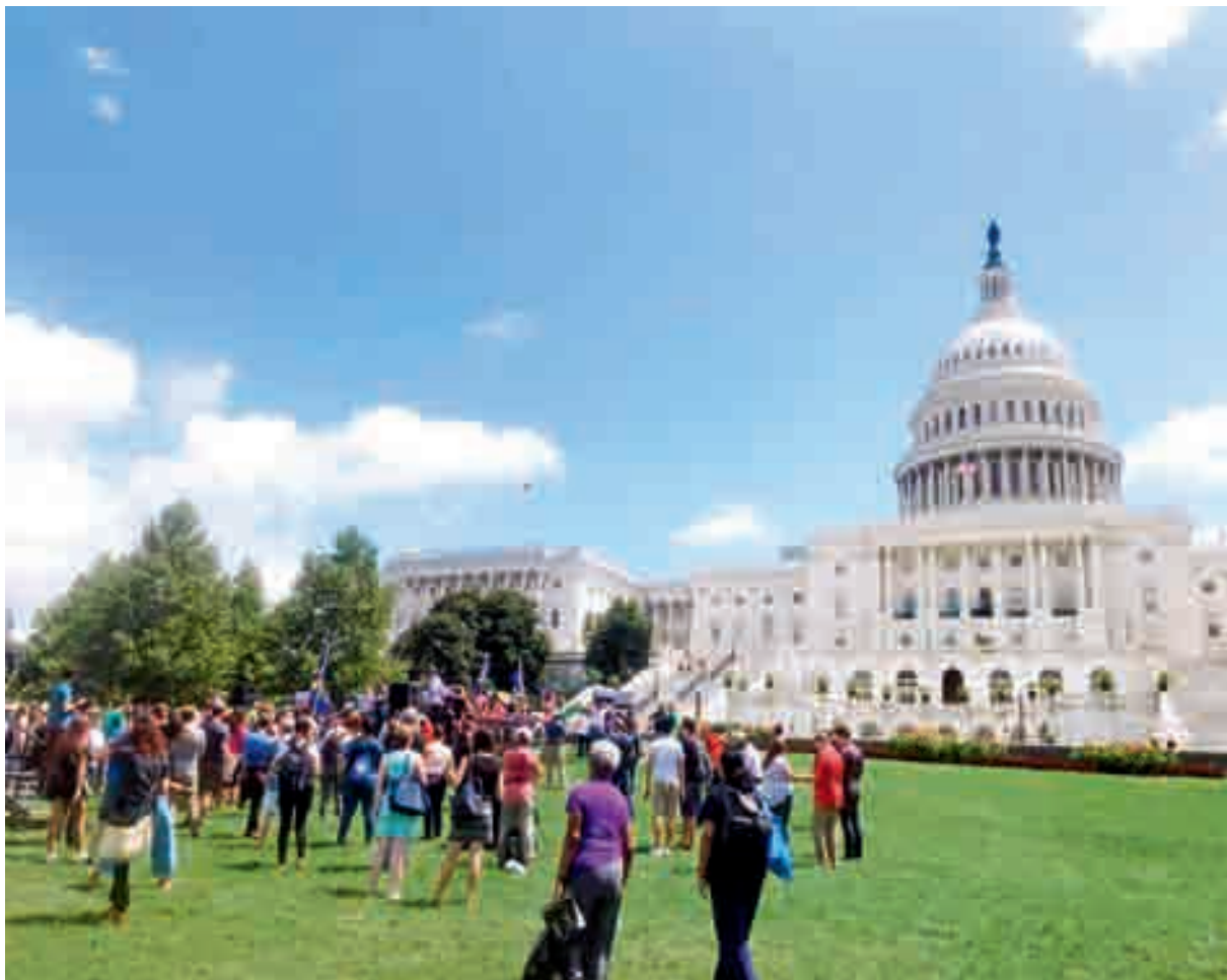
环保组织在美国国会大厦进行的环境教育宣讲吸引了人们驻足聆听