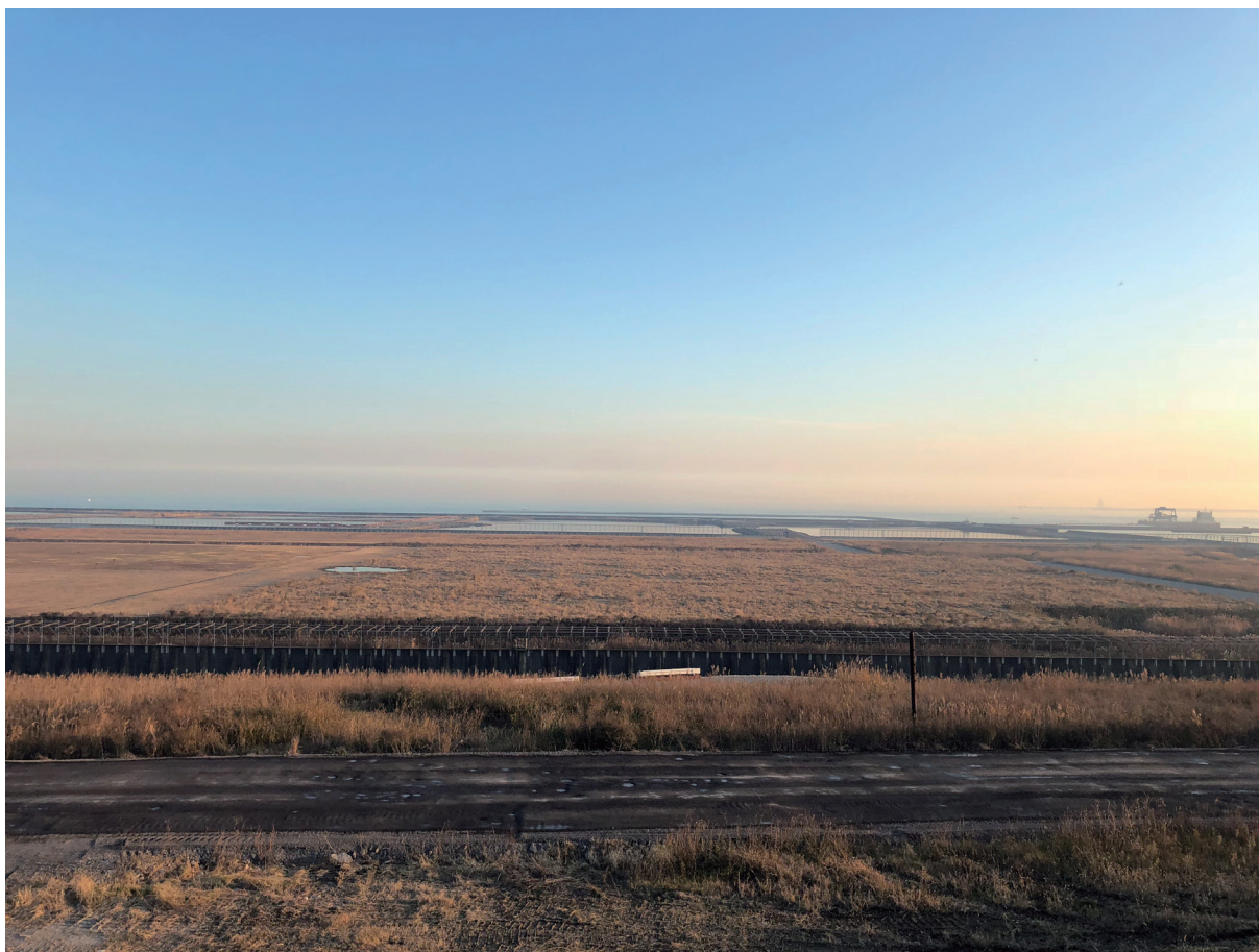
植被茂盛的东京中央防波堤