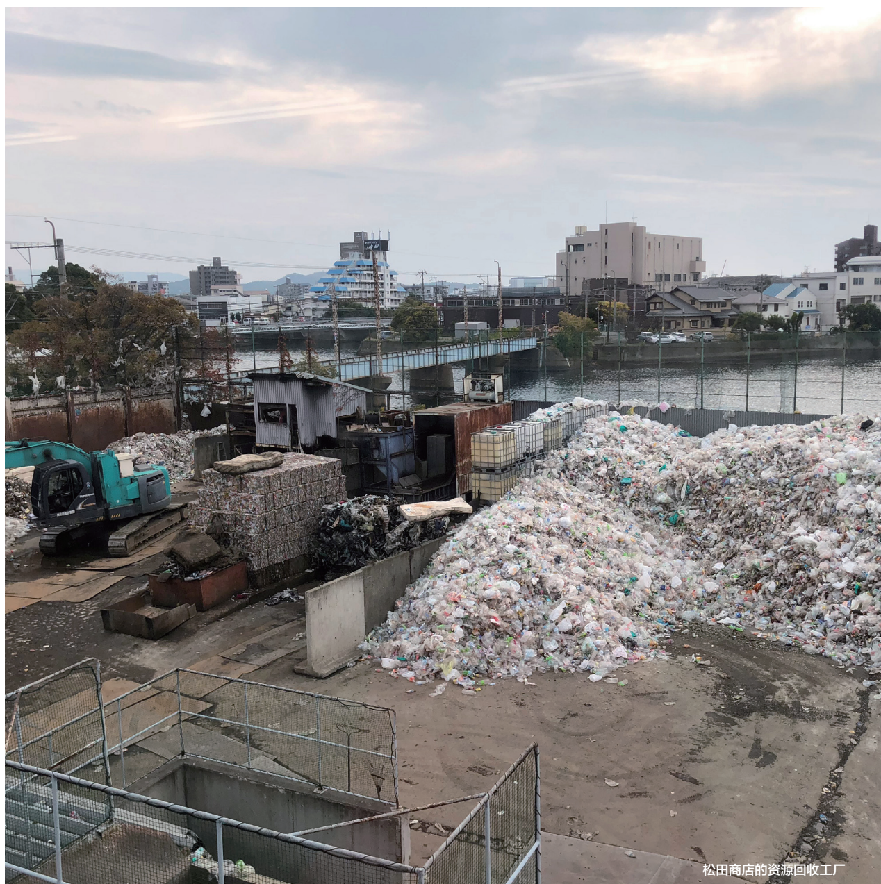
松田商店的资源回收工厂

为了保证满足环境教育工作的相关支出，日本《环境教育法》明确规定了国家及地方政府有权采取各类必要的财政及税制措施，以推进国民环境教育工作的开展，从而在制度层面解决了环境教育的资金短缺问题。