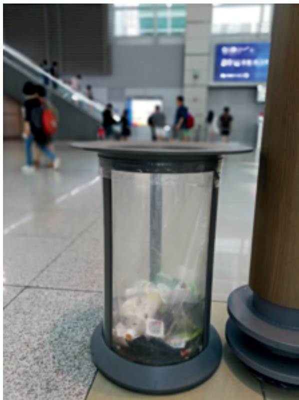
图2 仁川机场D候机楼内的垃圾箱