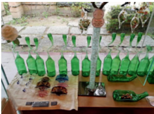
图7 废物打造的工艺品