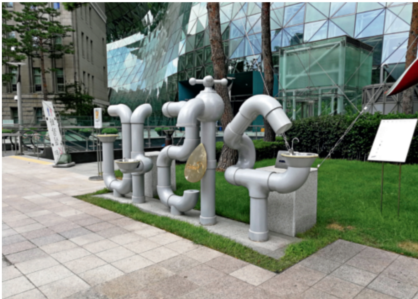
图1 首尔中心广场附近的直饮水设施

2017年8月7日至10日，笔者有幸参加了在首尔召开的中日韩三国优秀环境教育教师代表的交流活动，深入韩国社会、民间、学校了解了韩国开展环境教育的优秀成果，深深感受到韩国的环境教