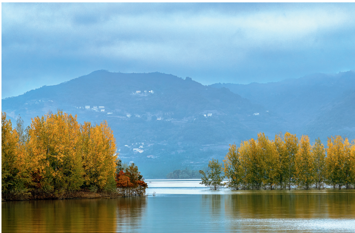
深秋湖景

系。保持严的基调,深入开展生态环境保护督察和执法监管,狠抓中央生态环境保护督察反馈问题的整改,适时组织开展省委生态环境保护督察,强化对市、县两级党委政府及相关部门、行业企业生态环境法律法规、标准政策、规划执行情况和生态环境质量改善情况的监督检查,压实属地责任,推动问题解决。强化执法监管,开展“两打”(严厉打击危险废物环境违法犯罪和重点排污单位自动监测数据弄虚作假违法犯罪)专项行动,严厉打击各类环境违法行为。