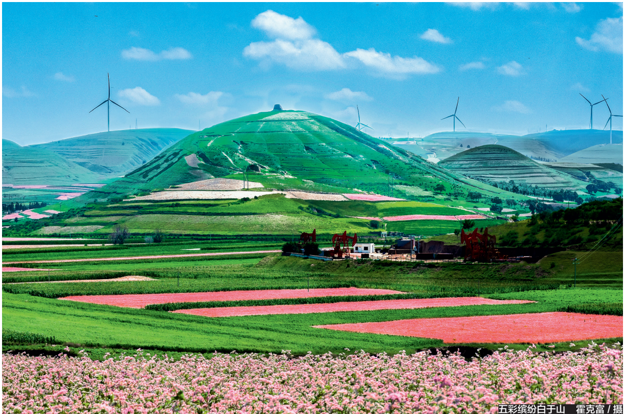
五彩缤纷白于山